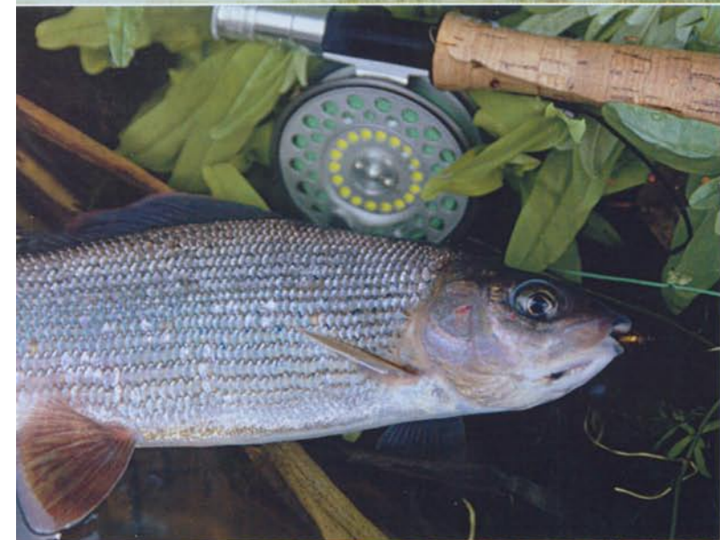
Stromab bei Resenborg ist die Fjederholt Au breiter und in manchen Gumpen sehr tief. Das Wasser ist herrlich klar, reich an Pflanzenwuchs und es gibt schöne Äschen.