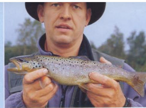
Für diese besondere Strecke nur ein kleiner Fisch: eine 45er Bachforelle – aber doch ein schöner Fang.