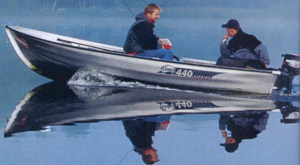
Morgennebel über dem Skanderborg-See. Wer es auf Raubfische abgesehen hat, braucht unbedingt ein Boot. Friedfischangeln ist auch vom Ufer aus möglich.

Als außergewöhnliches Hecht-Gewässer war der Skanderborg-See nie aufgefallen. Da erschütterte im Dezember 2004 ein Paukenschlag die dänische Hechtangler-Welt. Eine Gruppe dänischer Angler, berichtete die Zeitschrift Fisk og Fri , hatte 46 Hechte von über 10 Pfund gefangen, 23 davon über 16 Pfund, 10 über 20 Pfund, der schwerste 25 Pfund 400 Gramm. Sofort setzte ein Sturm von Hechtanglern auf den See ein. Der örtliche Angelverein reagierte erschreckt. Seitdem müssen sämtliche Hechte zurückgesetzt werden, denn in Dänemark fürchtet man Fleischmacher. Wenn ich den Dänen schon nicht die Hech-