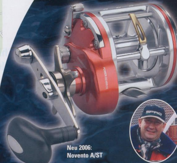
Neu 2006: Novento A/ST

Wer tief unter dem Meeresspiegel angelt, muß hoch über der Norm liegen. Wie unsere bärenstarke Trolling Multirolle Novento A/ST. Vom superstarken ALU-Gehäuse, über ein extra starkes Wechselgetriebe, Bremssystem und Kurbelknopf bis hin zu einer großen Schnurkapazität, 5 Kugellagern und vieles mehr, bringt sie alles mit für die Giganten der Tiefe.