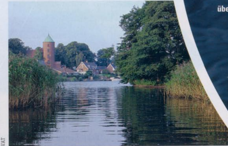
Die Schlosskirche von Skanderborg. Vor der Einfahrt in den kleinen Kanal an der Insel Æbelø findet man steinigen Grund, ideal für Barsche und Zander.