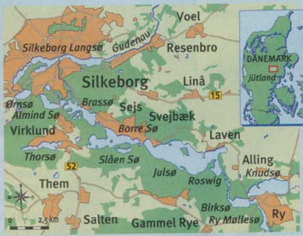
Silkeborg mit seinen Seen liegt in Ostjütland im Amt Århus. Dichte Wälder säumen die Seen