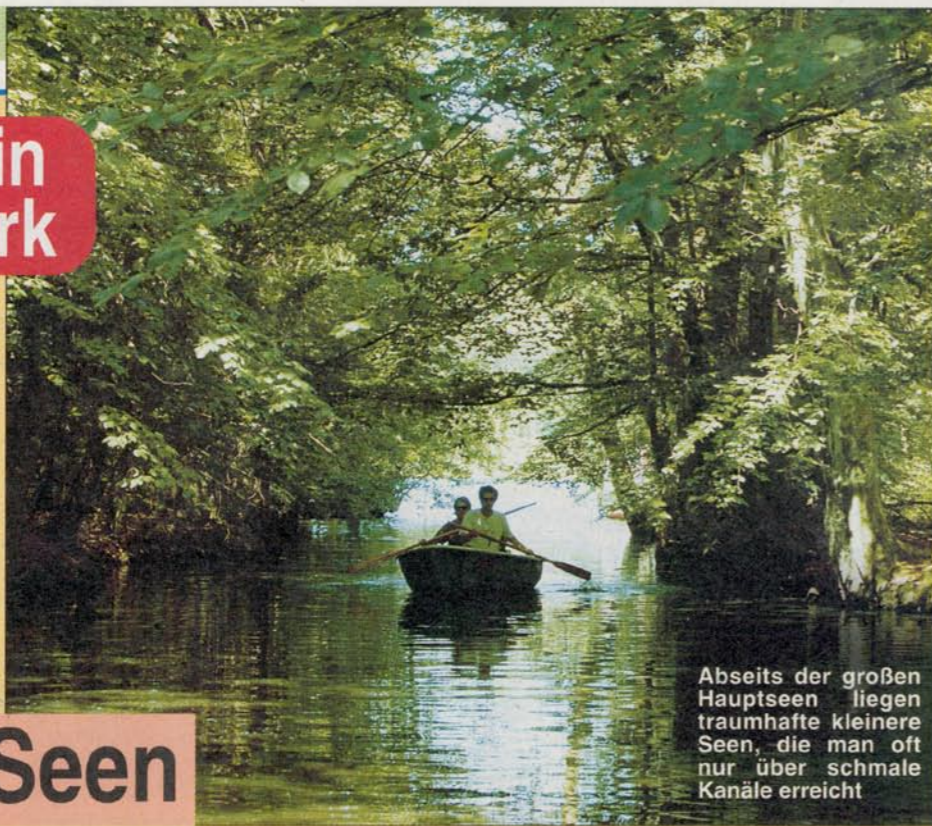
Abseits der großen Hauptseen liegen traumhafte kleinere Seen, die man oft nur über schmale Kanäle erreicht