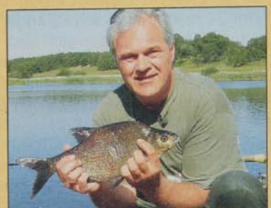
Für diese Brassen, die es in den Seen auch in zweistelligen Gewichten gibt, kommen sogar in den Ferien britische Angler nach Silkeborg

gelegener See, mitten im Wald. Traumhaft! Der Slæen Sø hat ausgezeichnete Hechte und Barsche, aber auch Forellen beißen hier an. Der See gehört nicht direkt zum Gudenå-System, wodurch sein Wasser klarer ist als in den übrigen Silkeborg Seen.